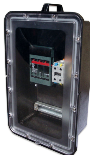
Wodoszczelna skrzynka EK 664 - IP 68 z przykładowym wyposażeniem