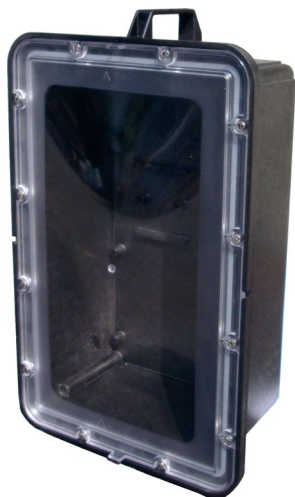
Wodoszczelna skrzynka EK 664 - IP 68